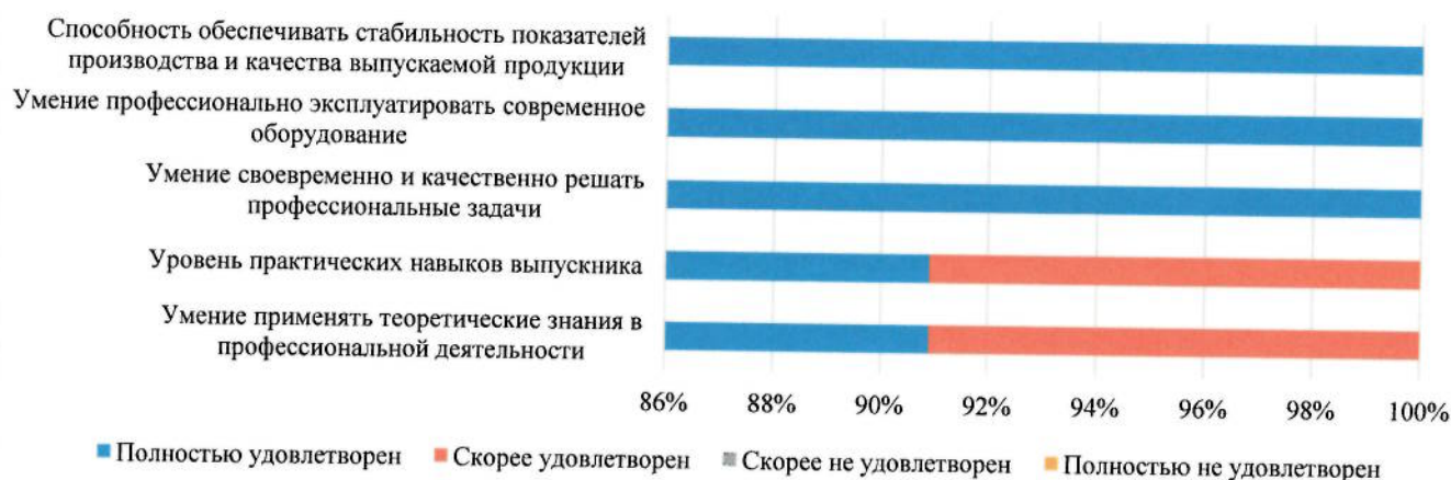
Степень удовлетворенности уровнем профессиональной подготовки выпускников по специальности «Поварское и кондитерское дело»

Анализируя ответы на данный вопрос, можно сделать вывод, что предприятия-партнеры в целом удовлетворены уровнем профессиональной подготовки выпускников. 100% респондентов полностью удовлетворены способностью обеспечивать стабильность показателей производства и качеством выпускаемой продукции, умением профессионально эксплуатировать современное оборудование, своевременно и качественно решать